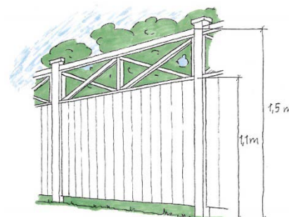
Exempel på tomtplatsavgränsning (bilden är inte skalentlig)

Den som skriver under som sökande är ansvarig för att avgiften betalas.